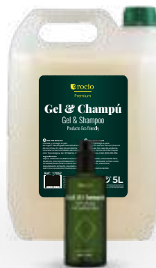
Gel & Champú 5l Ref.: 17072 300ml Ref.: 17067