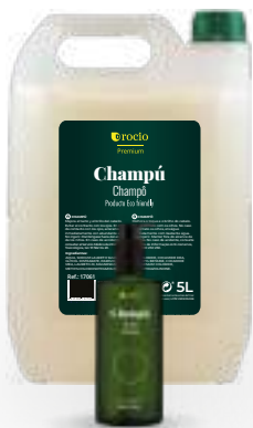
Champú 5l Ref.: 17074 300ml Ref.: 17061