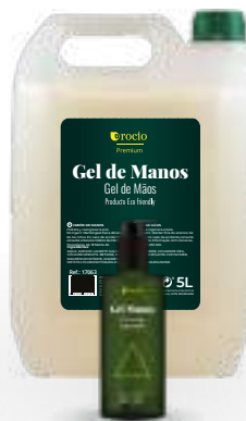
Gel de manos 5l Ref.: 17071 300ml Ref.: 17063