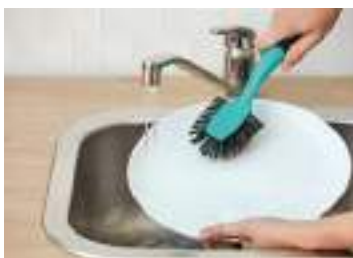
Cepillo limpia platos