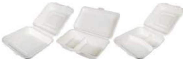
Envases para comida