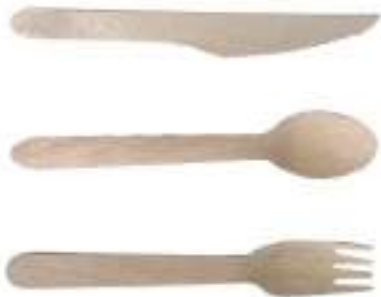
Cubiertos de madera

La madera vuelve a crecer y, además de biodegradable, es respetuosa con el medio ambiente. Boles y platos de papel fabricados con cartón de fibra virgen no contaminante, cubiertos y palillos decorativos de madera de abedul clara y bambú. Todos los productos fabricados con madera y bambú están totalmente aprobados para el contacto directo con alimentos secos, húmedos y grasos.