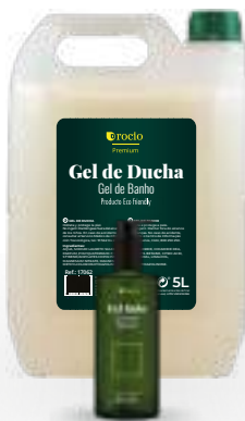
Gel de ducha 5l Ref.: 17070 300ml Ref.: 17062