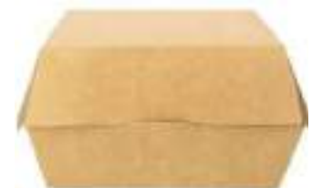
Envase Hamburguesa Kraft