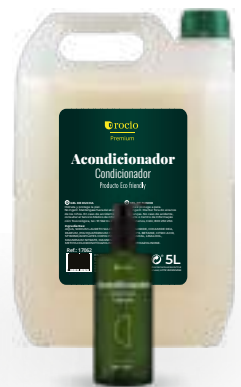
Acondicionador 5l Ref.: 17073 300ml Ref.: 17068