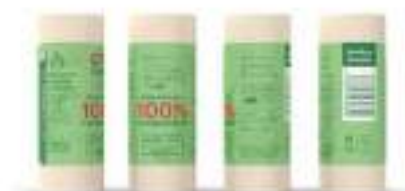
Compostables de comunidad