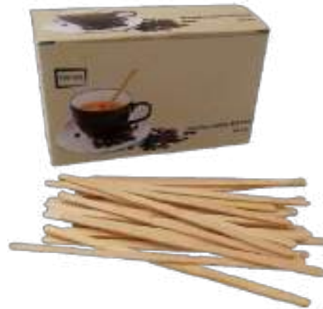
Removedor de madera